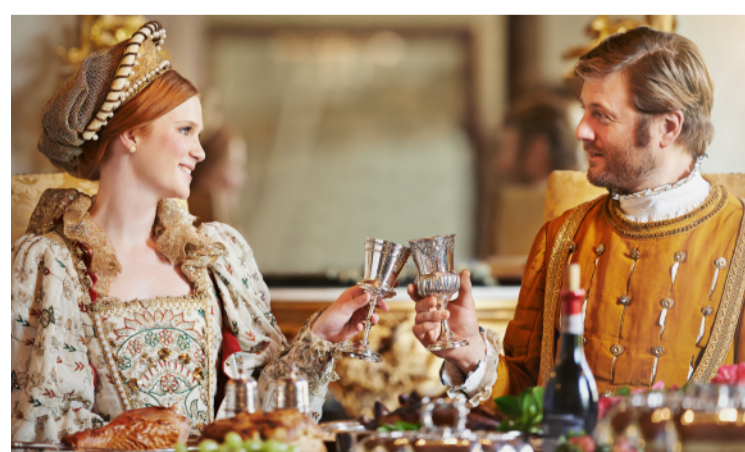
1840年頃、貴族の食事は 朝食と夕食の1日2回

紅茶などを飲みながら、サンドイッチやスコーン、ケーキなどの軽食を楽しむ習慣のことです。1840年頃、イギリスの貴族たちの間で始まりました。日本では、1990年代から外資系ラグジュアリーホテルが続々と上陸し、同時にアフタヌーンティーの提供が開始。アフタヌーンティー文化が徐々に日本に浸透していきました。