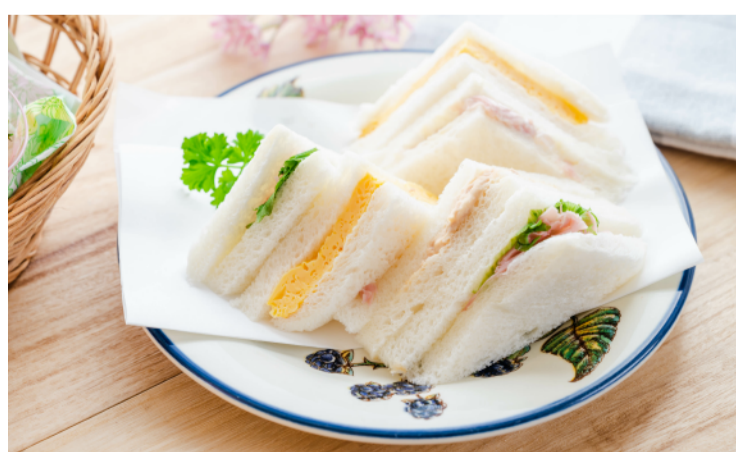
空腹を解消するため 夕方に軽食を食べるように