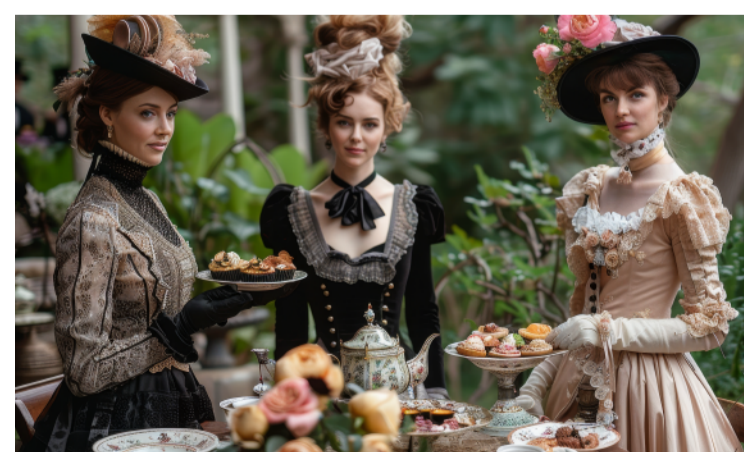
ひとりお茶会から 貴族の社交場として発展